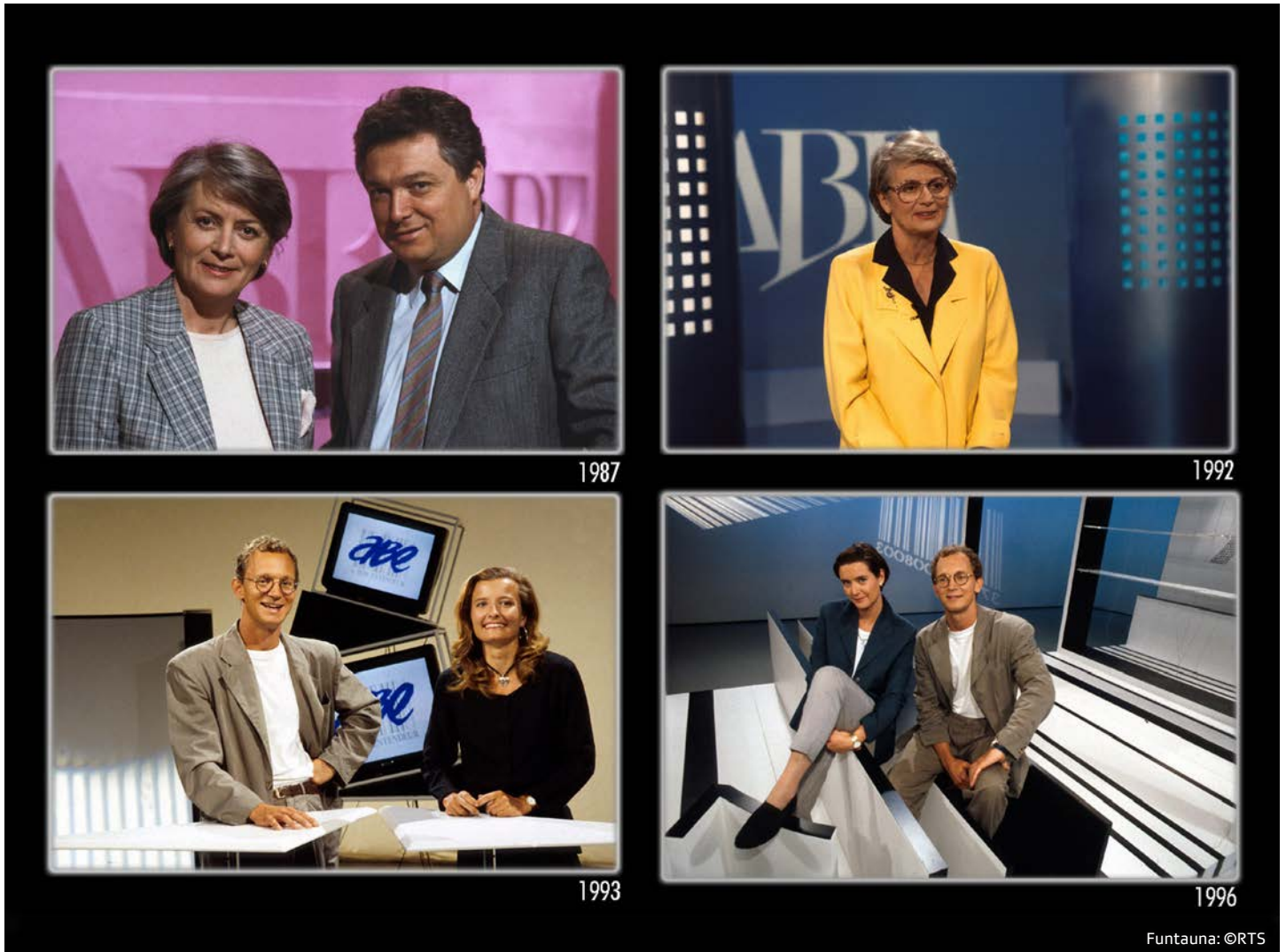
L'emissiu «A Bon Entendeur» da RTS en il decurs dal temp